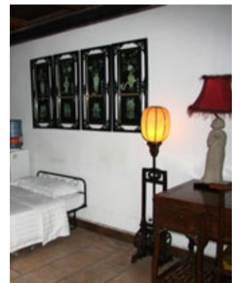
Jugendherberge in Xian Xiangzimen