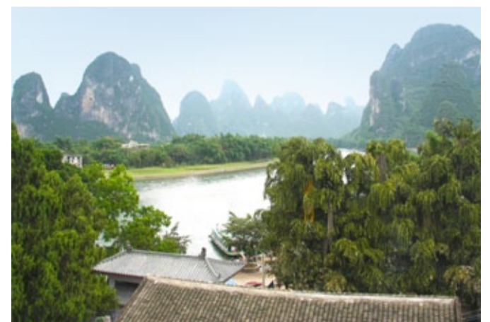
Blick aus einer Jugendherberge