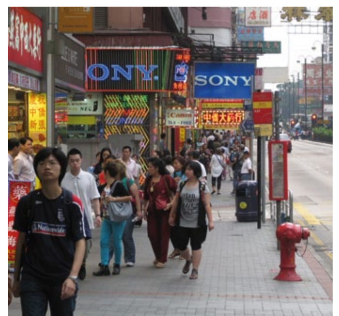
Shopping in Hongkong