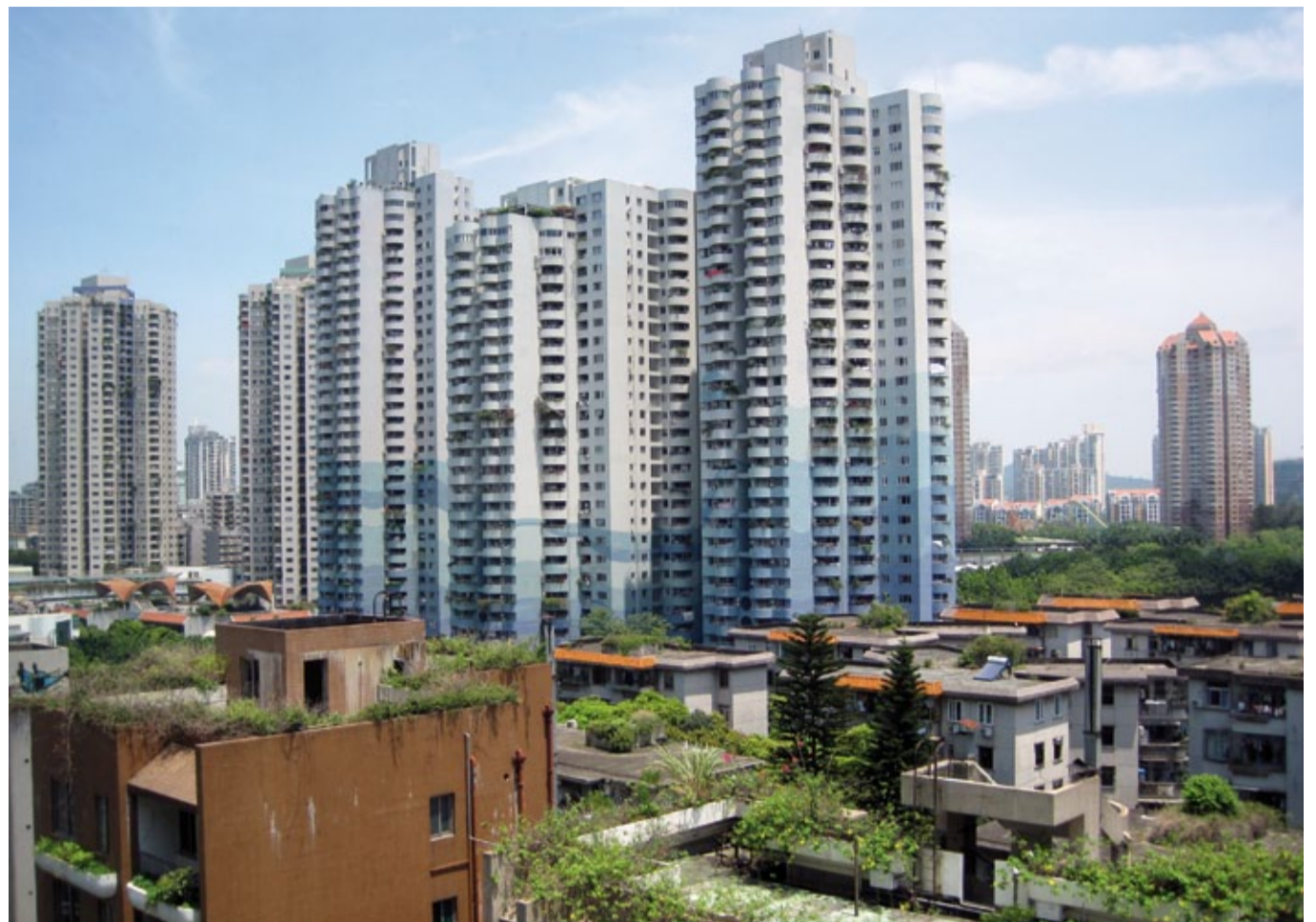
Blick über die Dächer von Shenzhen